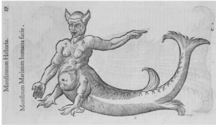
Figura 2 Monstrorum historia , 1642 de Ulisse Aldrovandi.