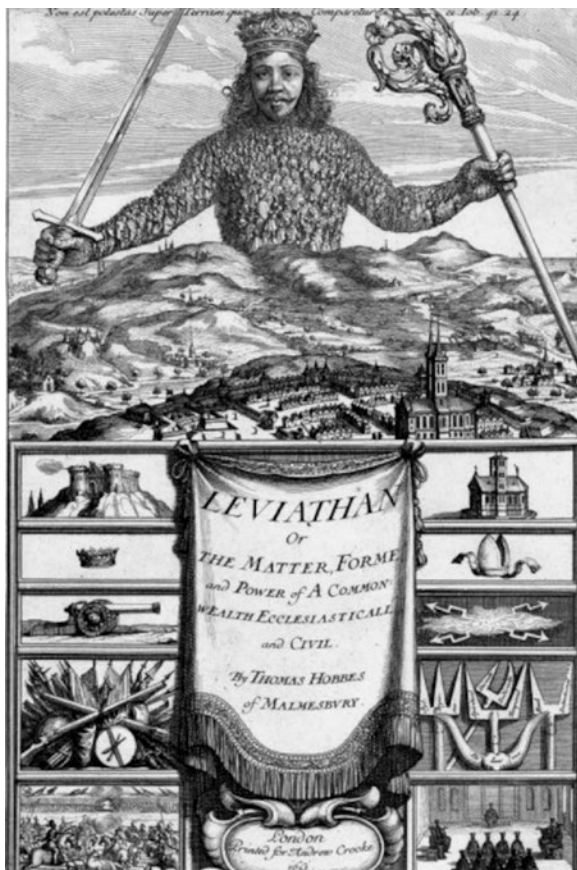
Figura 1. Leviathan or The Matter, Forme and Power of a Commonwealth Ecclesiasticall and Civil, 1651 de Thomas Hobbes diseñado por Abraham Bosse.