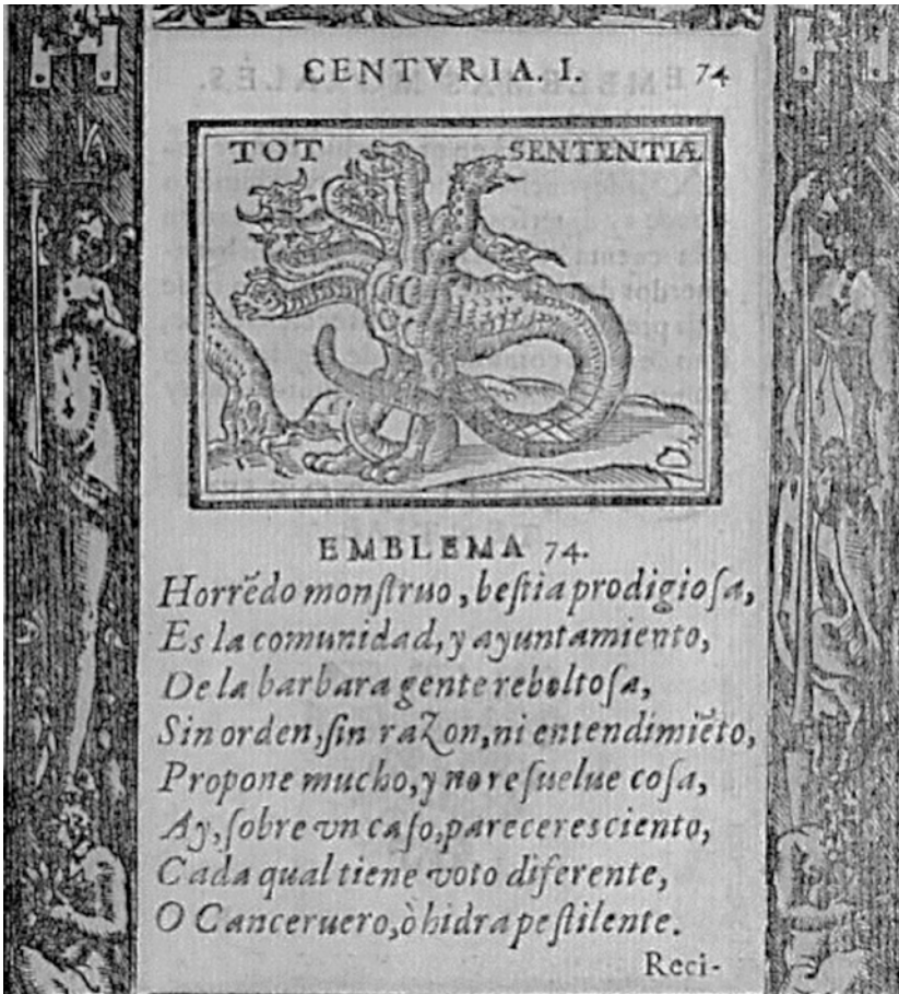
Figura 7. Tomado de Emblemas morales de Don Sebastián de Covarrubias Orozco (1610). Emblema 74, Centuria I. Para Hobbes es fundamental la distinción entre Multitud y Pueblo: Mientras un cuerpo se gobierna a sí mismo por medio de un soberano, el otro no mantiene orden alguno pues sería análogo a una hidra con cien cabezas. Razón por la cual una multitud no es una persona natural.