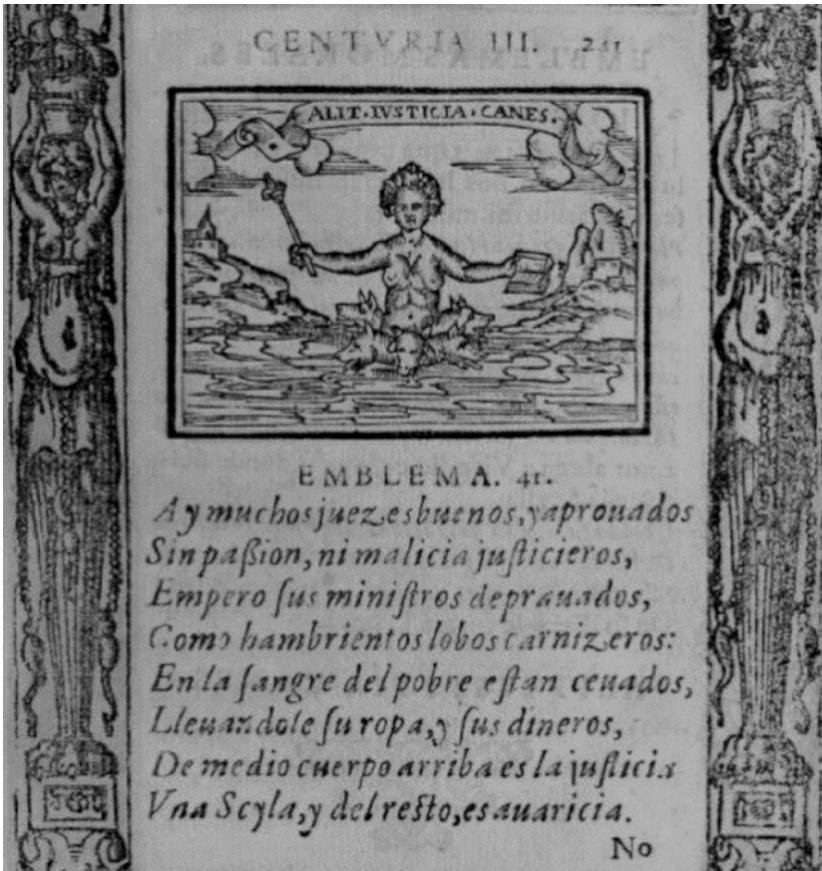
Figura 5 Tomado de Emblemas morales de Don Sebastian de Covarrubias Orozco (1610). Emblema 41, Centuria III.